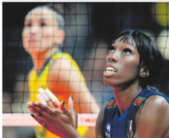
DI BRONZO Paola Egonu si è sfogata dopo il terzo posto al mondiale di volley