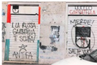
ALTRO CHE PACIFICAZIONE Le offese apparse a Roma dopo l'elezione di La Russa al Senato

Ma i paradossi non finiscono qui. Nell'elezione a presidente del Senato Ignazio La Russa ha usufruito dell'aiuto di Matteo Renzi, l'«ammazza governi». Ora è evidente che la sortita del terzo Polo punta a dividere la maggioranza: Calenda e Renzi hanno un disegno lucido - e per di più esplicito - staccare gli azzurri dalla maggioranza del prossimo governo per rilanciare uno schema simil-Draghi. In sintesi: la Meloni si è affidata nella partita di Palazzo Madama ai suoi più insidiosi avversari. L'ultimo paradosso è la «non curanza» verso il fattore aritmetico. Non ci vuole il pallottoliere per scoprire che gli azzurri sono determinanti sia alla Camera, sia al Senato. Anzi, la riduzione dei parlamentari senza che il Parlamento abbia adeguato la sua organizzazione ai nuovi numeri (specie Montecitorio) richiede una maggioranza che abbia margini non solo sufficienti ma ampi. In questa situazione mortificare un partito determinante, e i suoi parlamentari, è un comportamento che oltre un certo limite sfocia nel masochismo. Se si parla di un premier e di un governo che vogliono durare.