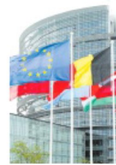
BUROCRAZIA Le sedi Ue sono tre

sumo energetico sarà circa dell'1% con un risparmio di 33.000 euro». Le stesse istituzioni Ue si sono rese conto che si tratta di risparmi quasi ininfluenti, così il segretario generale Welle ritiene che «con l'avvicinarsi dei mesi invernali, è necessario valutare ulteriori misure a breve termine». Una delle ipotesi è lo «spegnimento del riscaldamento/raffreddamento, lasciando che la temperatura negli edifici giunga a una temperatura minima (in inverno; massima in estate), che può essere portata alla normale temperatura di funzionamento in tempo utile» sia dal giovedì sera al lunedì mattina sia durante le prossime festività (Ognissanti e Natale/Capodanno). Nel primo caso si tratterebbe di un risparmio pari a 2.246.930 euro, mentre per le festività di 289.078 euro. Leggere queste cifre per i cittadini europei costretti a tirare la cinghia e a razionare l'energia nei prossimi mesi anche a causa delle politiche energetiche errate compiute dall'Ue negli anni passati, non può che contribuire a diffondere un sentimento di scetticismo verso le istituzioni comunitarie. Per questo occorre un segnale forte da parte dell'europarlamento per dare il buon esempio che non può limitarsi ad abbassare la temperatura negli edifici.